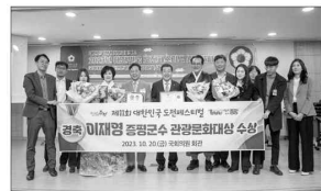
관광문화대상 수상 후 기념촬영 모습

을 기념해 세계적인 바이올리니스트 장 유진 초청 연주회를 개최하고, 지역의 군부대(87사단, 제13특임여단)와 함께 하는 민·군·관·촌의 장엄을 통해 지역 화합을 도모했다. 또한 주민들의 의견을 반영해 보강원 에 버스(김리)공간 공연장 1곳을 추가 설치하고, 버스(김리)공간을 활성화함으로 에 보강원(미리)마을을 버스(김리)번지 로 만들겠다는 방침이다. 이 밖에도 증평 인삼물축제에 성공 의 개최로 인삼물 축제가 문화체육관광 부와 한국관광공사의 K-컬처 관광이 벤트 100선 에 선정되는 성과도 거뒀 다.